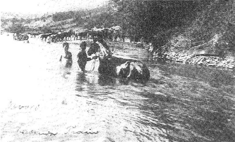
Abb. 2: „Badender Train“ im Devoli; September 1917

Die Truppe nutzte an den heißen Sommertagen jede Möglichkeit, sich und die Pferde im Meer oder in den Flüssen zu erfrischen.