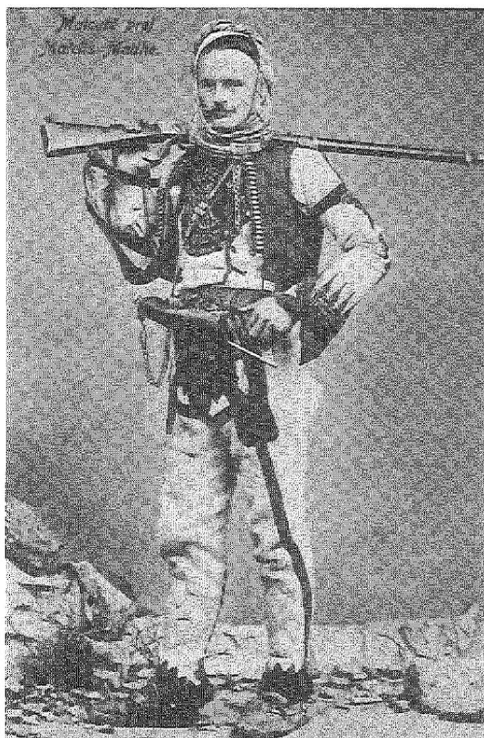
Abb. 4: Bergbewohner aus Nordalbanien, 1918 oder früher

Ansichtskarten dieser Art wurden in großer Zahl von österreichischen Offizieren und Soldaten zu Verwandten geschickt und trugen das Ihre dazu bei, das Stereotyp des kriegerischen und stets kampfbereiten Albaners zu prägen.