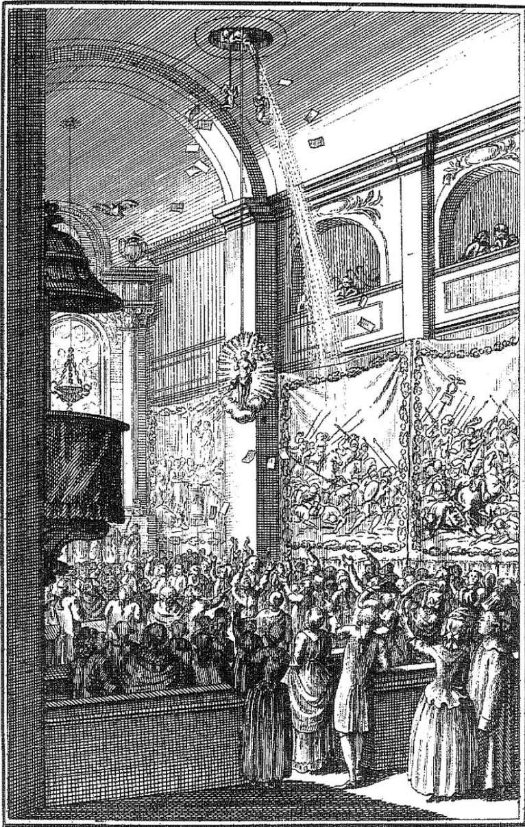
Abb. 3: „Ueber die Himmelfahrt“