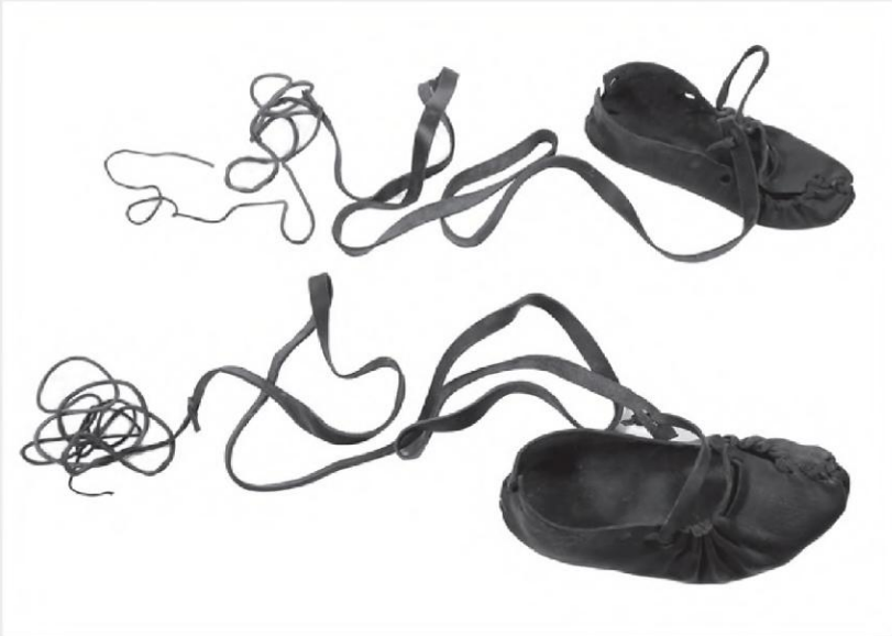
Abb.1: Aus dem Museum der Kulturen in Basel: Lederschuhe chodaky . Mszanec, Polen; vor 1910; VI 3635.