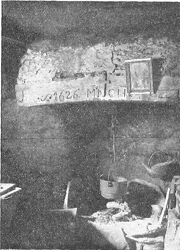
Fig. 3. Kaminecke aus einem Kücheninterieur.

Aus dem Rauchhut hängt von einem Querbalken eine durch Verzahnung verstellbare Feuerkette herab, die den Kochtopf über dem Feuer trägt. An der Wand über dem Kaminherd, wo man Feuerzange und Schürhaken aufzuhängen pflegt,