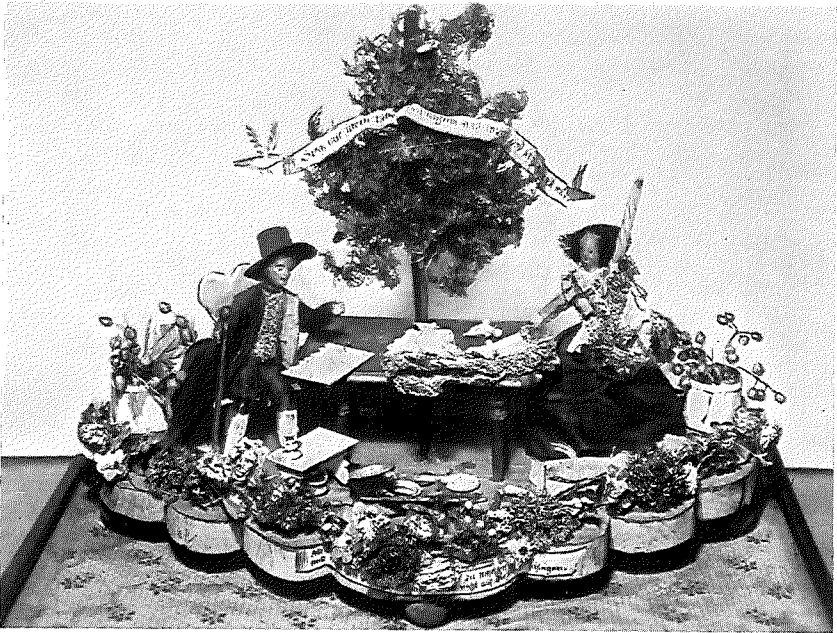
Biedermeierliche Hochzeitsgruppe mit Lebensbaum.