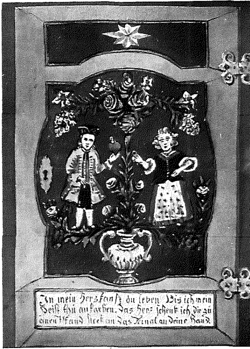
Abb. 1: Schranktür, rotbrauner Grund, hellblau gerahmt. Elbogner Kreis, Böhmen